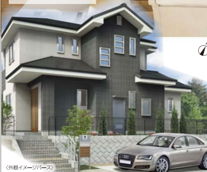
〈外観イメージパース〉

全部屋南向き！光いっぱい降り注ぐリビングには子育てママにとってもうれしい家事室を設備。キッチン⇄家事室⇄キッズルームと動線がつながっているので、お料理しながら、お洗濯ものを片付けながらの子育てもラクラクです。リビングと和室を合わせれば22.5帖のビッグスペース！親戚を招いてのホームパーティーもおまかせ下さい。2階は大容量小屋裏収納も完備。