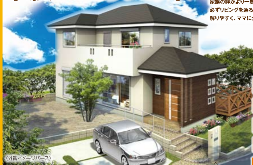
〈外観イメージパース〉

人気のリビングセンター仕様で、家族の絆がより一層深まります。必ずリビングを通る動線で、家族みんなが解りやすく、ママに大人気です！